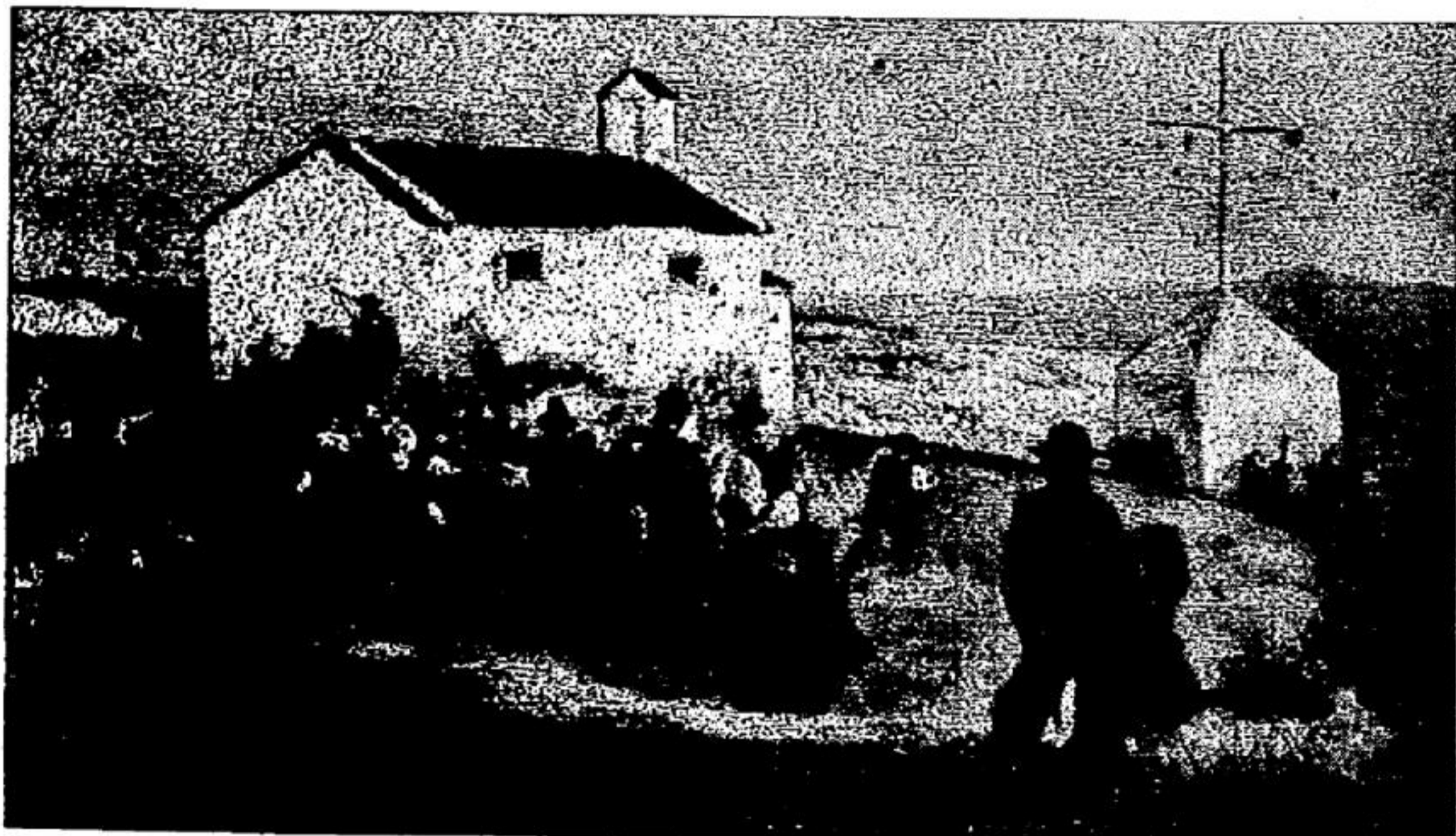
Romería de Santa Cruz de Ribadeo

¿Qué nos resta decir a nosotros? Nada. Nuestra autoridad en la materia, es insignificante, y por más que nos esforzásemos, cuanto agregásemos, a lo que