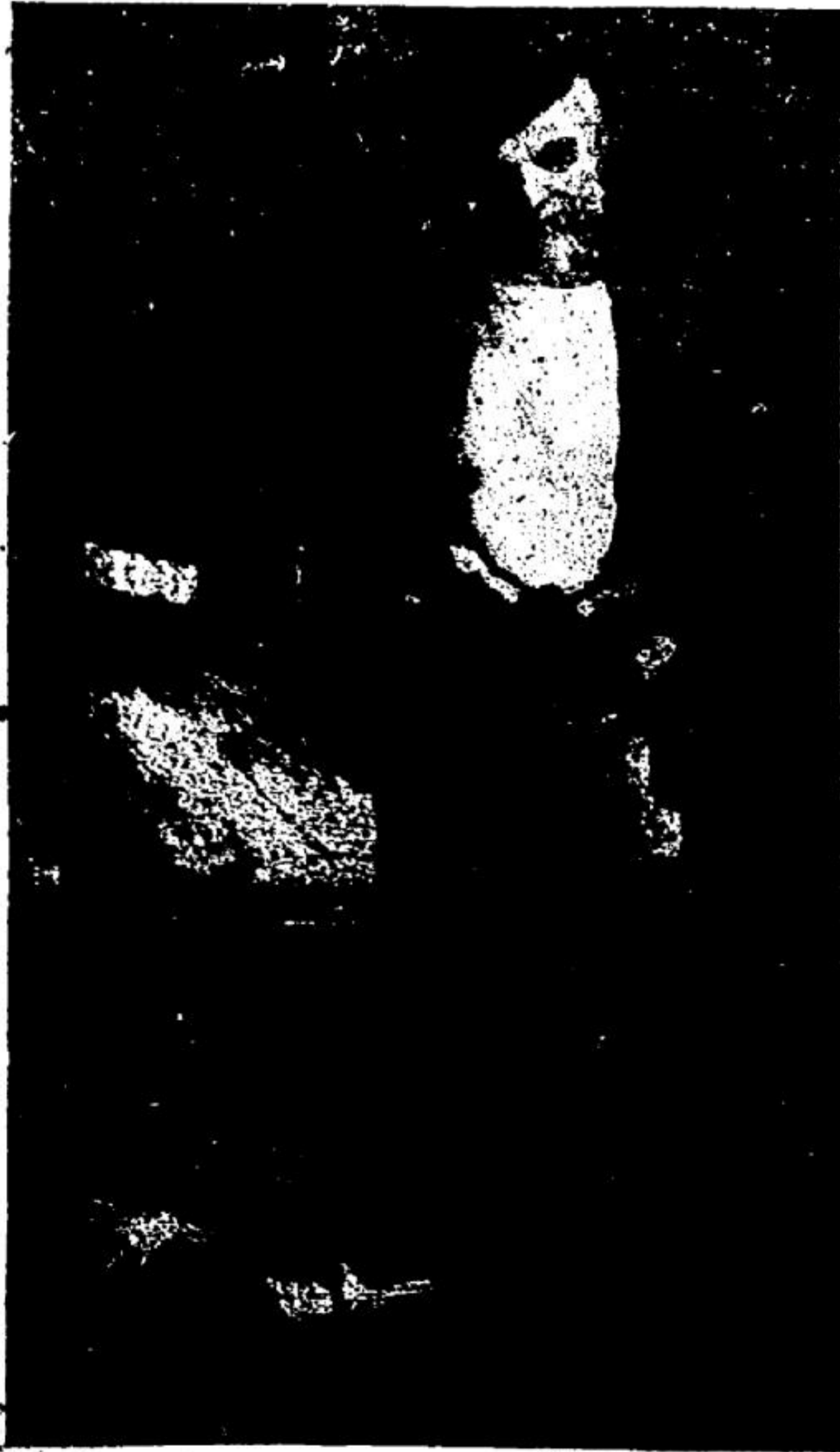
Marinero de Rinlo, cuadro al óleo

Y por último, el cuadro “Pagando el foro”, tiene un ambiente conseguido por otros tan bien combinados y unos