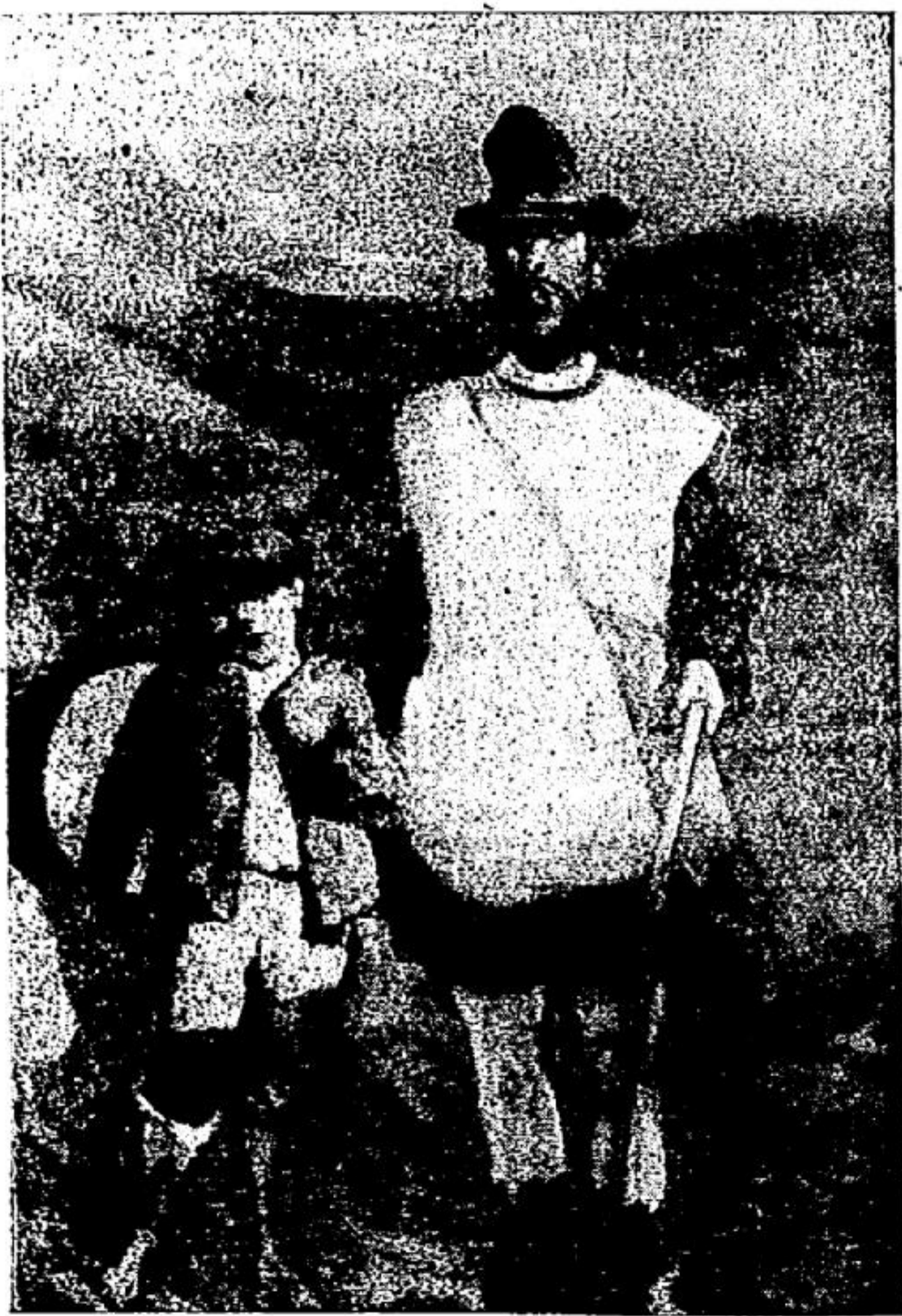
"O Crego", cuadro al óleo

Que el éxito sea completo corone sus esfuerzos!