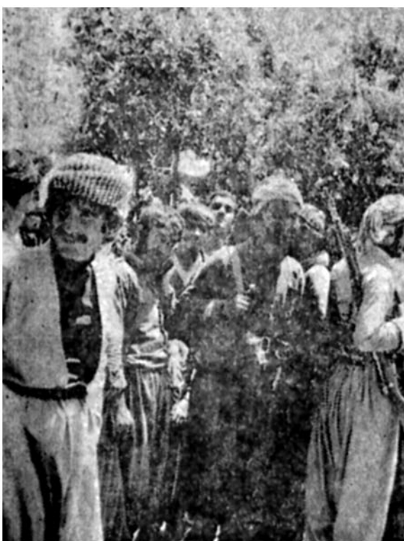
میوان- خبرنگار اعزامی

آوارگان میوان برغم همه شایعات ضد و نقیض، در اردوگاه «بیر سلیمان» بیای صندوقهای رای رفتند و نمایندگان خود را برای مجلس خبرگان برگزیدند. مکتب‌گرومی از آوارگان را در حال رای دادن نشان میدهد.