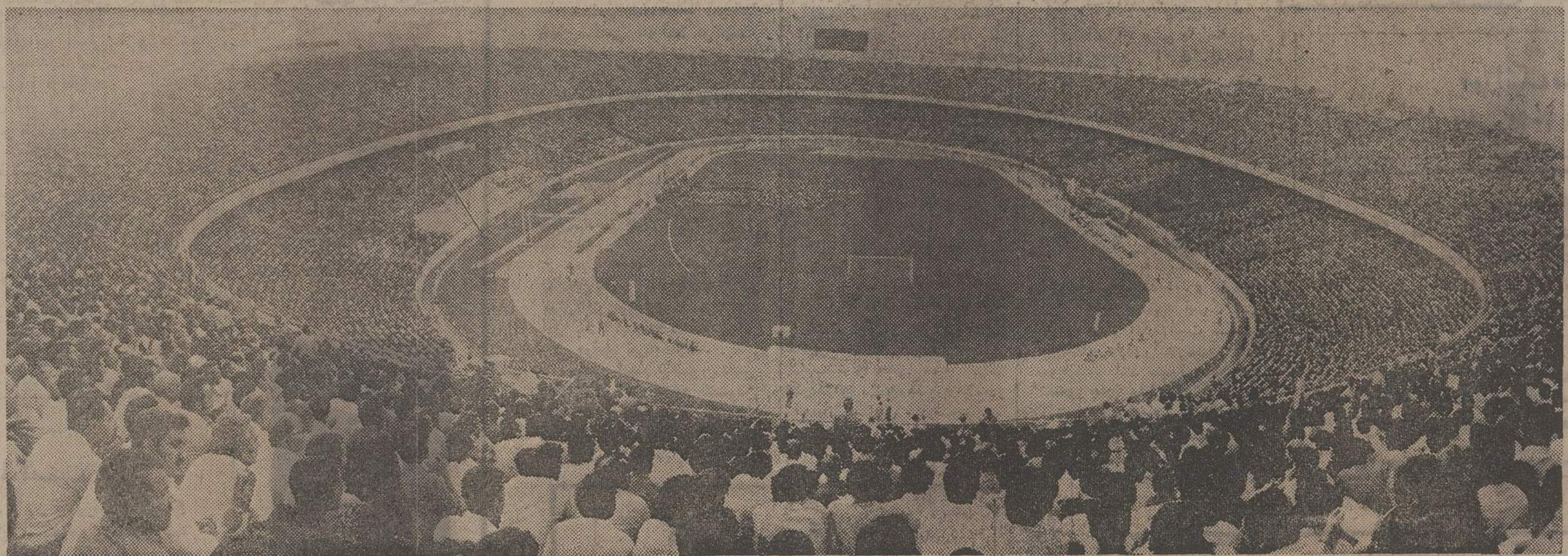
روز نهم مردادماه ۱۳۵۲ با فرمان شاهنشاه، استقرار حاکمیت مطلق بر منابع و صنایع نفت ایران پس از سالهای دراز، صورت تحقق بخود گرفت و موج غلبی از شادی در طبقات مختلف مردم بوجود آورد و میلیونها نفر در سراسر کشوری برای سیاست‌گذاری از رهبری خردمندانه شاهنشاه در اجتماعات پرشوری شرکت کردند. این عکس تاریخی سال گذشته روز نهم مردادماه از اجتماع مردم تهران در استادیم صدر هزار نفری آریامهر برداشته شده است.

آنچه که در آمار امسال جالب است اینست که ۱۳۱۱ نفر از پذیرفته شدگان دختر و ۱۵۵۵ نفر پسر هستند تا دو سال پیش در حدود هفتاد و پنج درصد از دانشجویان دانشگاه پهلوی پسر بودند. نکته دیگر آنست که بالاترین معدل پذیرفته شدگان در رشته طبیعی ۱۹٫۱۱ و در رشته ریاضی ۱۹٫۲۴ و در رشته ادبی ۱۸٫۵۵ و کمترین معدل در رشته های مختلف به استثنای رشته های فیزیکی، تاریخ و پرستاری از ۱۵ بیشتر بوده است.