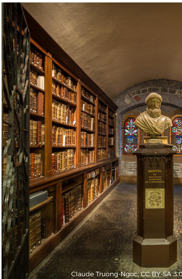
Claude Truong-Ngoc, CC BY-SA 3.0