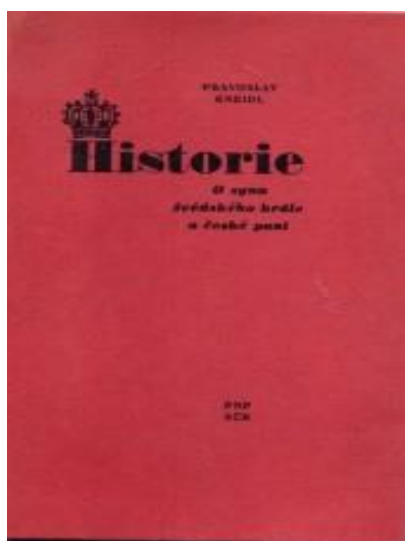
Book: Pravoslav Kneidl, 1984, Historie o synu švédského krále a české paní