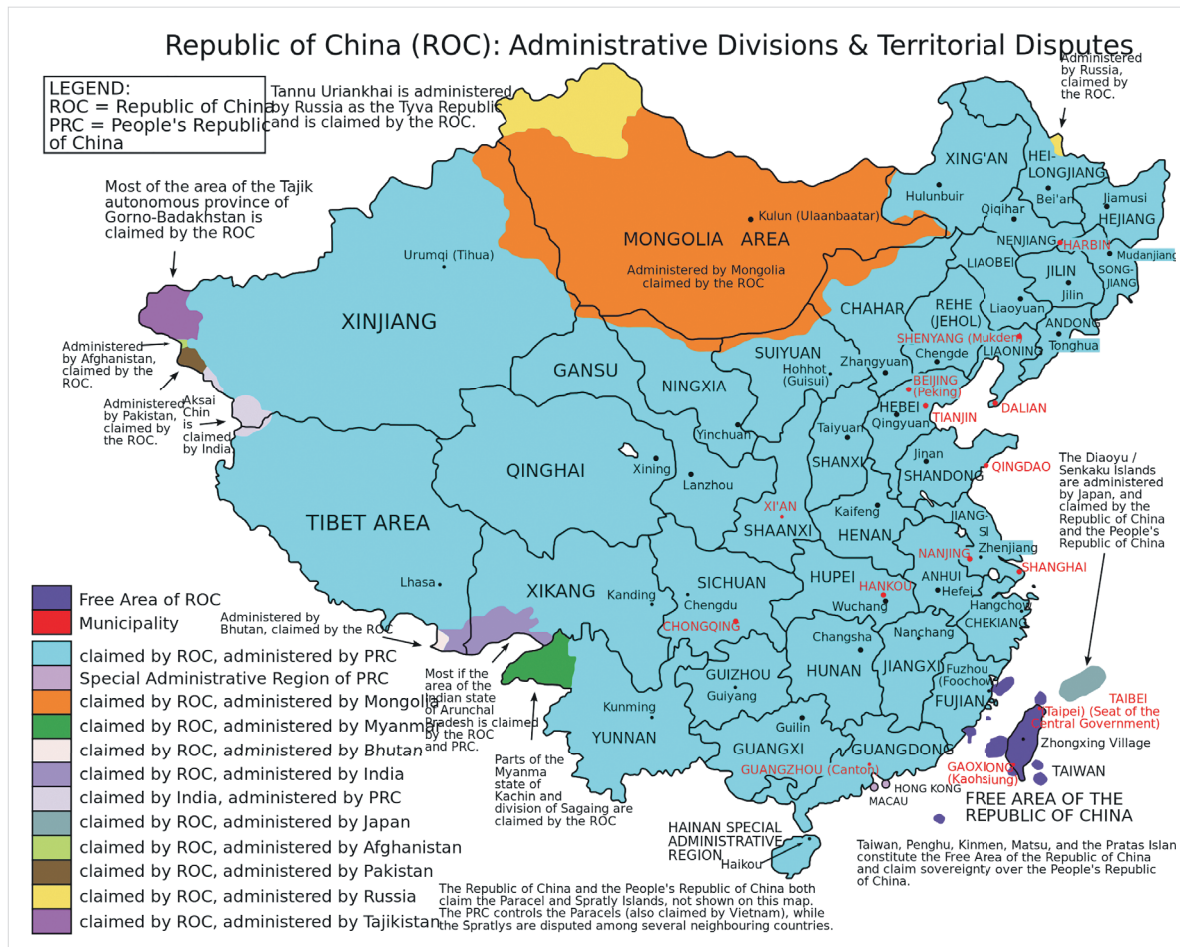
Офіційна територія Китайської республіки

З 1945 до 1975 року в Європі відбулося лише чотири випадки приєднання територій, причому три з них було проведено дипломатичним шляхом і спиралося на демократичні принципи. Прово-