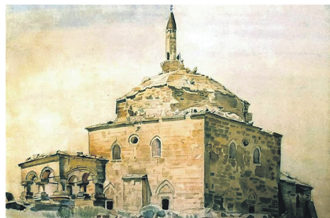
Мечеть у Колечі, Костянтин Богаєвський