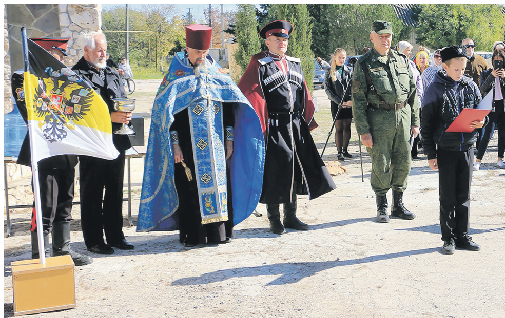
«Верстання кадетів Кіровського казачого хутора». С. Медведеве Чорноморського району АР Крим, 14.10.2018 р.