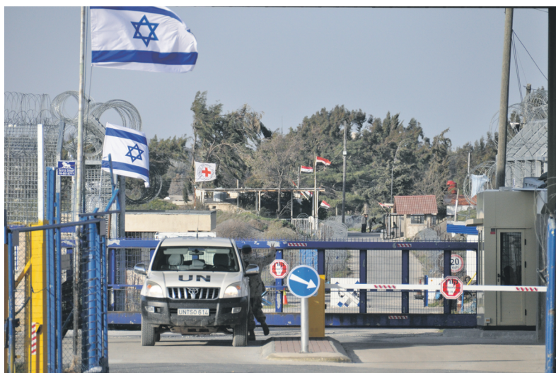
КПП на Голанських висотах

На всьому кордоні завдовжки понад 2000 км між двома націями зі спільним населенням у півтора