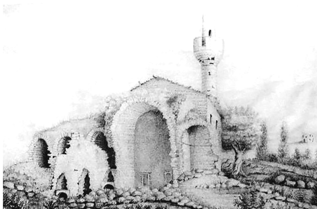
Мечеть хана Узбека, Вікентій Руссен

Олександра Невського, який буквально за півстоліття зруйнувала радянська влада).