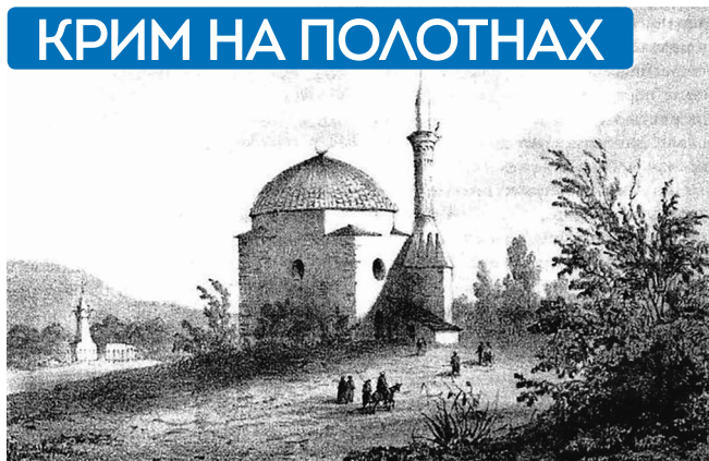
Карагозька мечеть, Вікентій Руссен