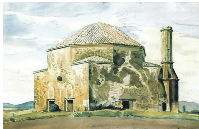
Карагозька мечеть, Костянтин Богаєвський

Літографюра із зображенням мечеті в селищі Карагоз (після 1948 р. – село Первомайське Кіровського району) була створена 1843 року. На ній ми можемо побачити селян, що йдуть (а хтось їде) до мечеті – прямокутної будівлі із традиційним для кримських татар черепичним дахом у формі купола і мінаретом. Карагозька мечеть – одна з найдавніших пам'яток періоду Золотої Орди, типо-