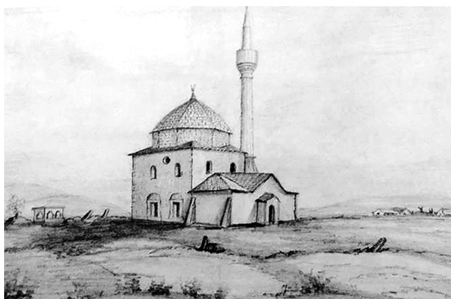
Мечеть у Колечі, Вікентій Руссен