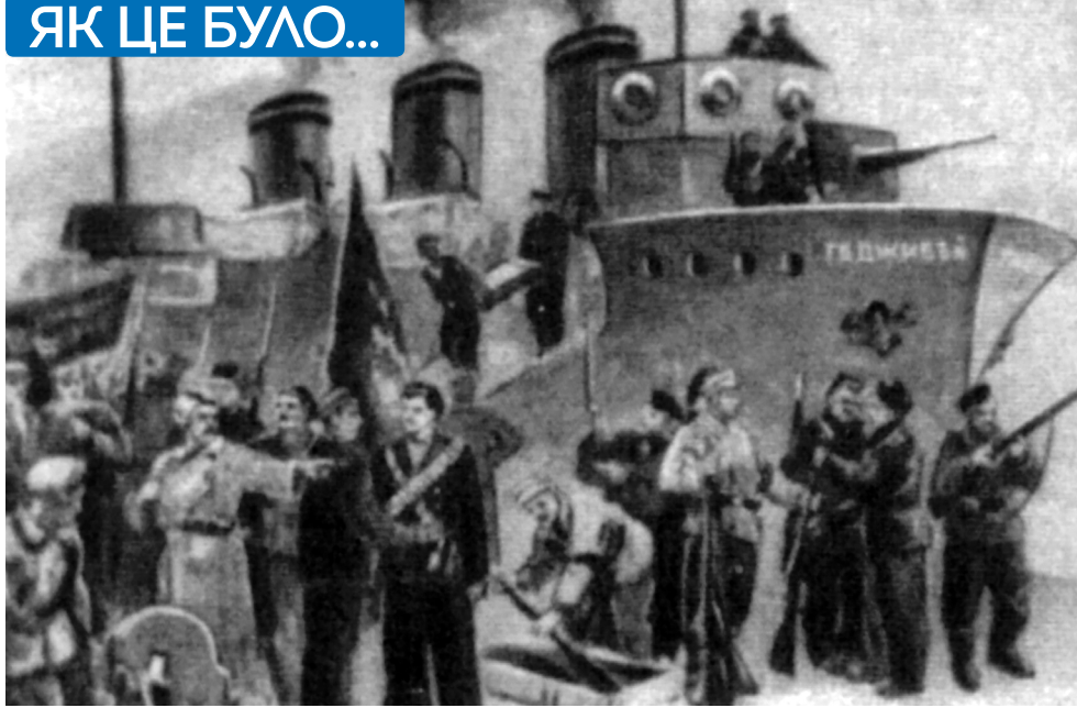
Міноносець «Гаджибей» доставив на своєму борту в ялтинський порт десант з 200 матросів і великий запас зброї та боєприпасів для місцевих червоногвардійців