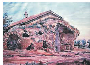
Мечеть хана Узбека, Костянтин Богаєвський

вий приклад османської архітектури. Її розібрали за радянських часів.