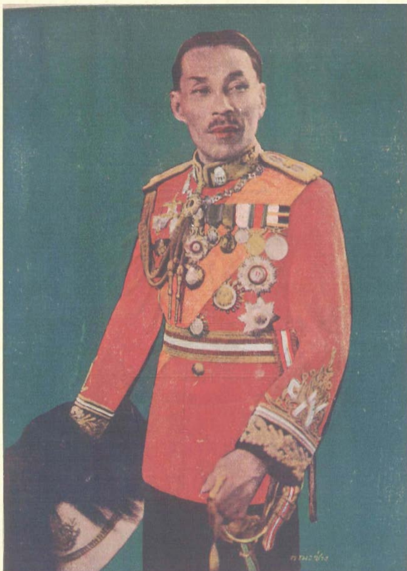
พระเจ้าวรวงศ์เธอ กรมหมื่นอนุวัตน์จาตุรนต์ ทรงถ่ายเมื่อ พ.ศ. ๒๔๓๑