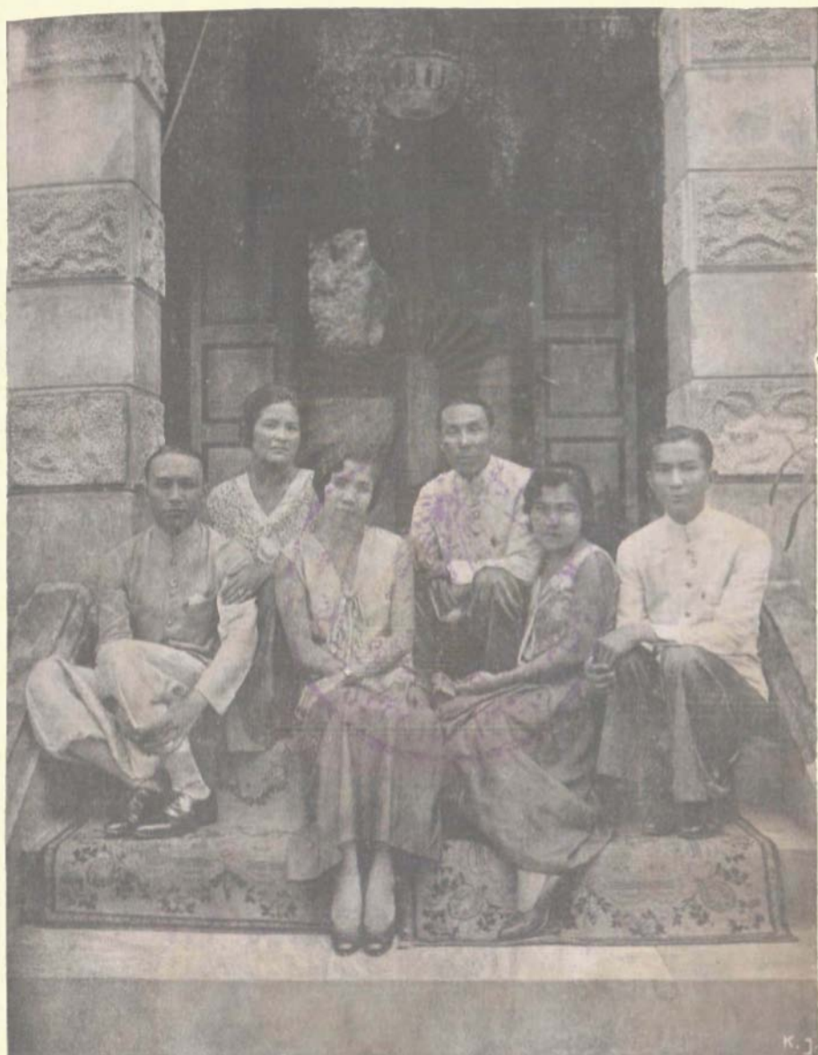
พระเจ้าบรมวงศ์เธอ กรมหมื่นอนุวัตน์จาตุรนต์ ทรงถ่ายพร้อมด้วยหม่อม, โอรสและธิดา เมื่อ พ. ศ. ๒๔๗๕