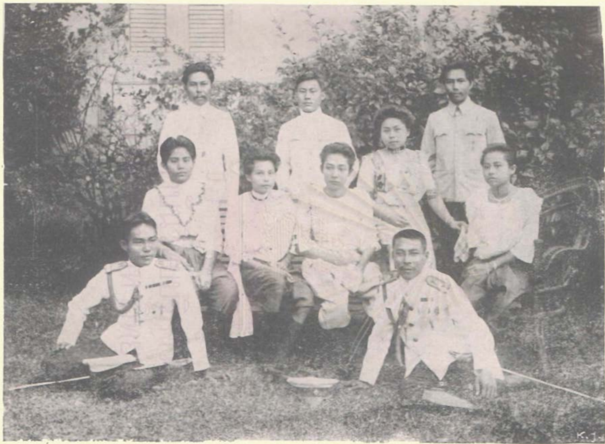
พรอรุณหมู่ ทรงถ่ายเมื่อ พ.ศ. ๒๔๕๗