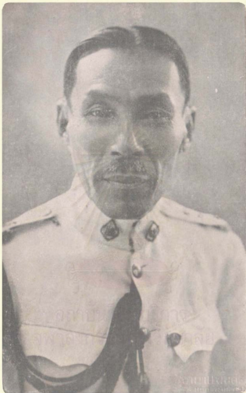
พระเจ้าวรวงศ์เธอ กรมหมื่นอนุวัตน์จาตุรนต์ ทรงถ่ายเมื่อ พ.ศ. ๒๔๗๔ ภายหลังได้ทรงดำรงตำแหน่ง ประธานคณะผู้สำเร็จราชการแทนพระองค์