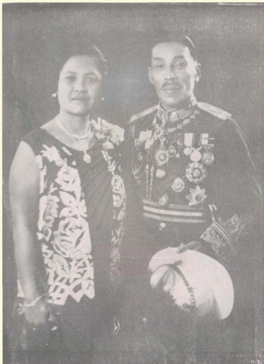
พระเจ้าวรวงศ์เธอ กรมหมื่นอนุวัตน์จาตุรนต์ ทรงถ่ายพร้อมด้วยหม่อม เมื่อ พ.ศ. ๒๔๗๑