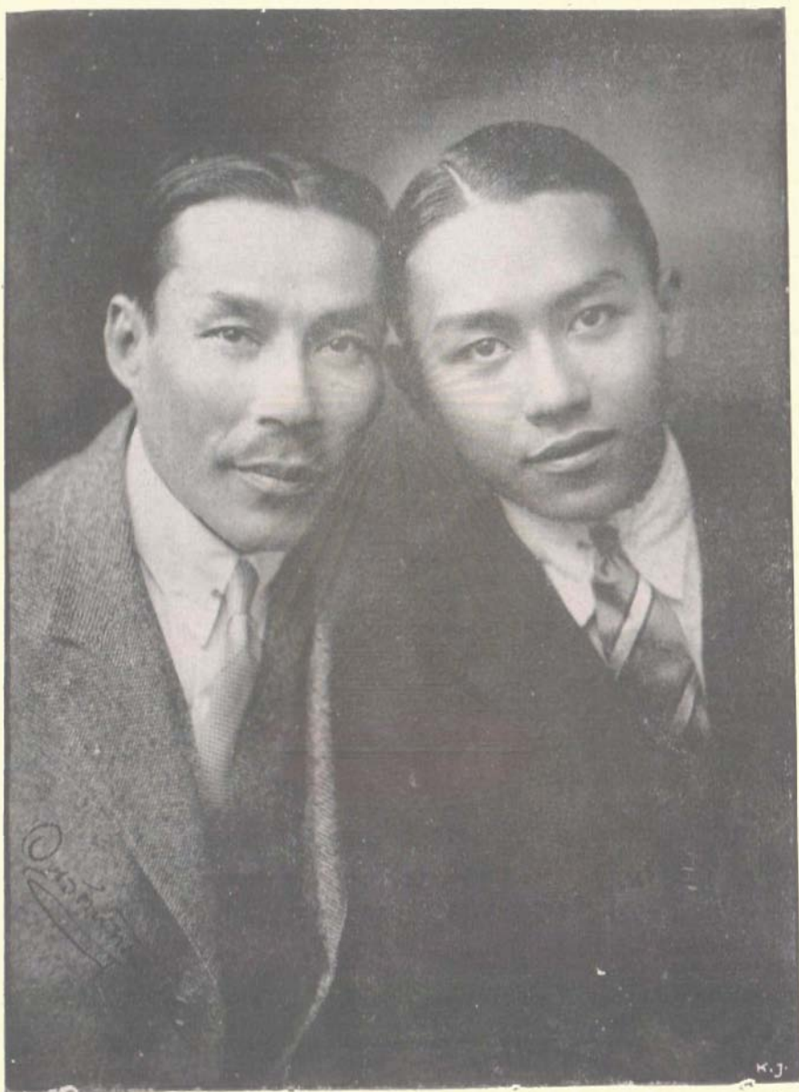
พระเจ้าวรวงศ์เธอ กรมหมื่นนครสวรรค์ ทรงถ่ายที่ยุโรป เมื่อ พ.ศ. ๒๕๐๕ พร้อมด้วยหม่อมเจ้าคัสตารัสจักรพันธ์